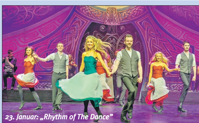
23. Januar: „Rhythm of The Dance“