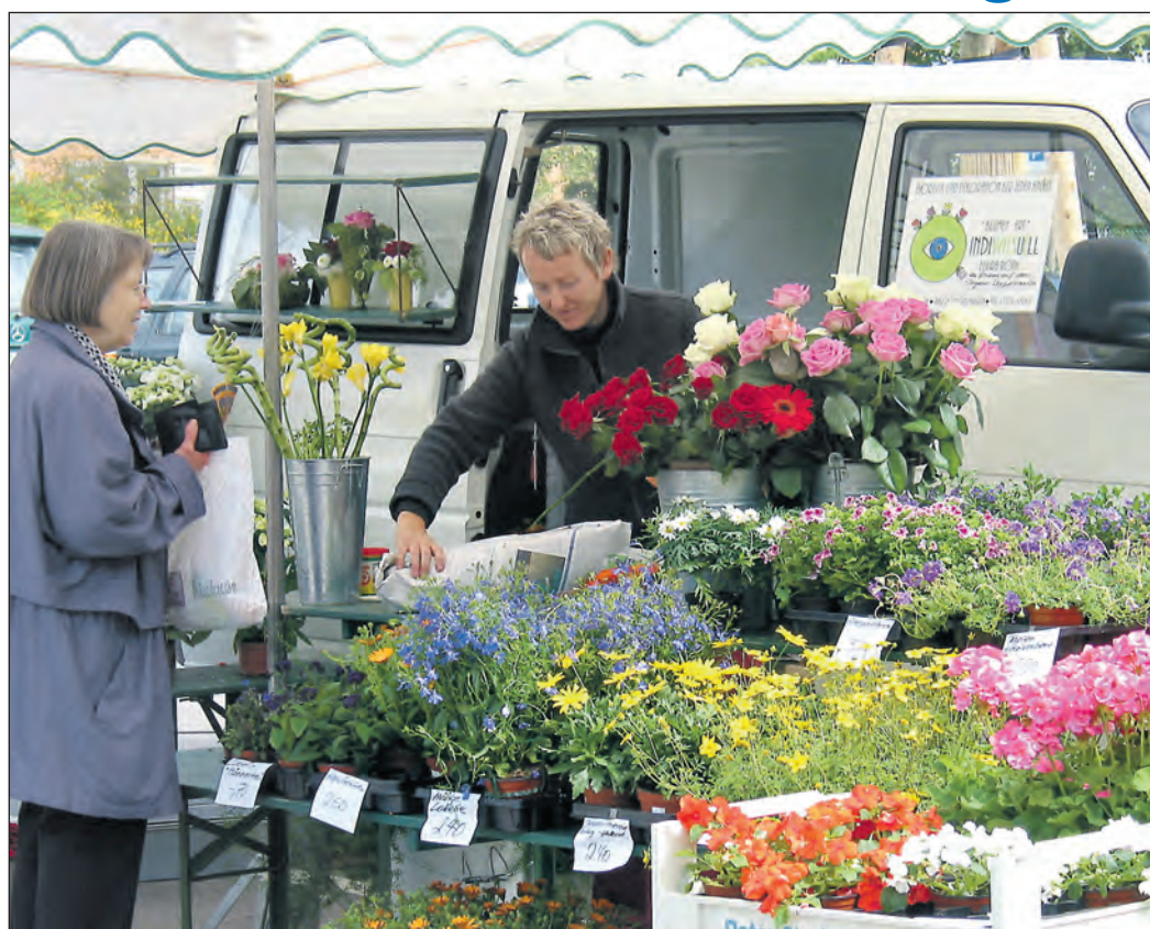
Der erste Dienstags-Wochenmarkt in diesem Jahr findet am 7. Mai auf dem Kirchplatz bei der Herz-Jesu-Kirche statt. Die Marktbesucher freuen sich darauf, ein vielseitiges Angebot an frischen Lebensmitteln, Pflanzen und Blumen präsentieren zu dürfen.