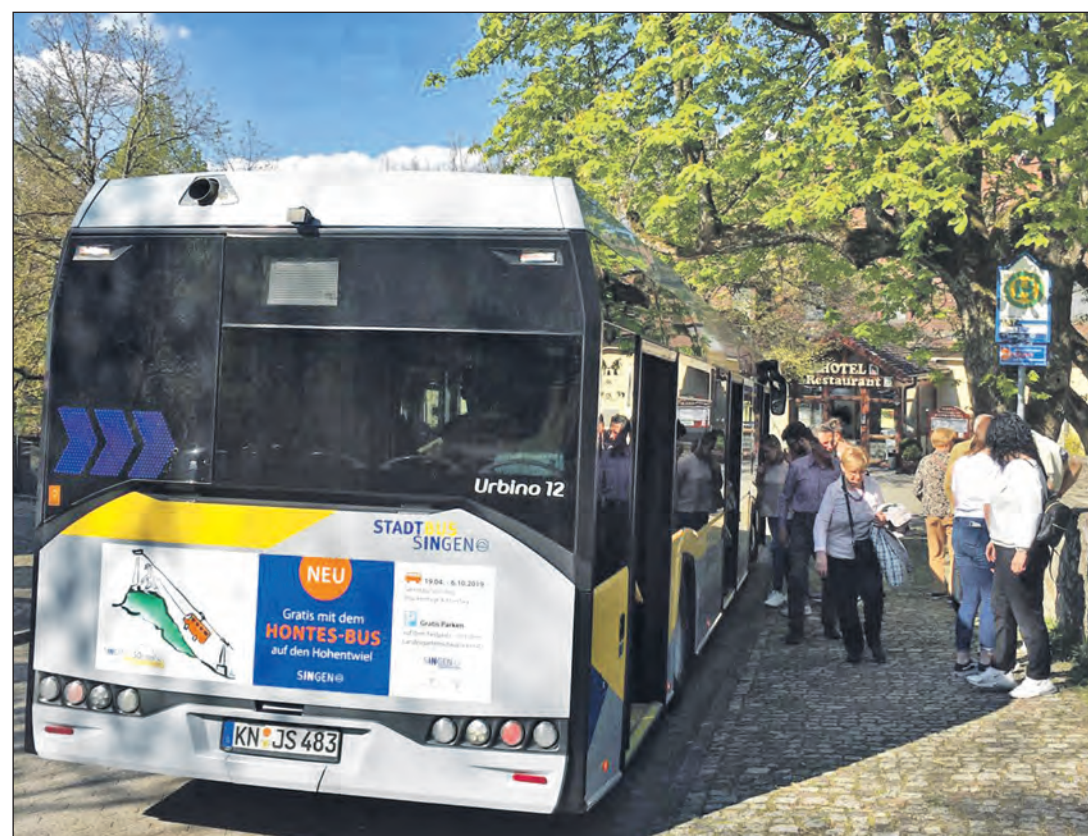
Die Fahrgastzahlen zum Start des kostenfreien Hohentwiel-Shuttles (Linie 8) können sich sehen lassen: An Karfreitag nutzten 101 Personen den Hontes-Bus, am Samstag 90, an Ostersonntag 97 und am Ostermontag 212. Der Shuttle fährt an Wochenenden, Feiertagen sowie Brückentagen und er startet stündlich ab 10.05 Uhr am Singener Bahnhof (letzte Fahrt 18.05 Uhr). Einsteigen kann man an den Haltestellen „Rathaus-Stadthalle-Feuerwehrstraße“, Bahnhof „Landesgartenschau“ und in der Hohentwielstraße. Bequem zurück geht es stündlich vom Hohentwiel Infozentrum (10.15 - 18.15 Uhr).