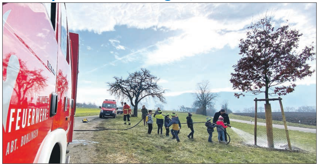
Im Frühjahr wurde schon eifrig geprobt (unser Bild), um für heiße Sommertage fit zu sein. Angesichts der Hitzetemperaturen müssen die jungen Gießpaten jetzt richtig ran: Die Kindergruppe der Feuerwehr Bohlingen hat eine „Gießpatenschaft“ für die Jubiläums-Eiche des Stadtteils übernommen. Mit ein bisschen Unterstützung und großer Freude wässern die Gießpaten den gepflanzten Baum. Das Gießen ist ein fester Bestandteil der monatlichen Kindergruppenstunde.