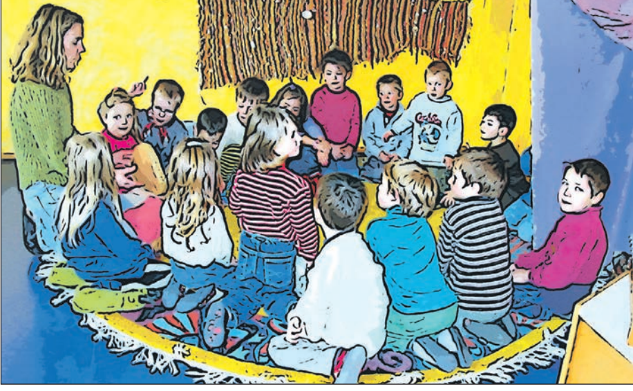
Wer hat Interesse? Das Projekt „Direkteinstieg Kita“ sucht Quereinsteigerinnen und Quereinsteiger, die eine Ausbildung zur sozialpädagogischen Assistenz machen wollen.

Eine Anmeldung unter archiv@singen.de oder Telefon 07731/85-317 ist erwünscht. Rückfragen gerne an Telefon 07731/85-253 (oder Mail, siehe Anmeldung)