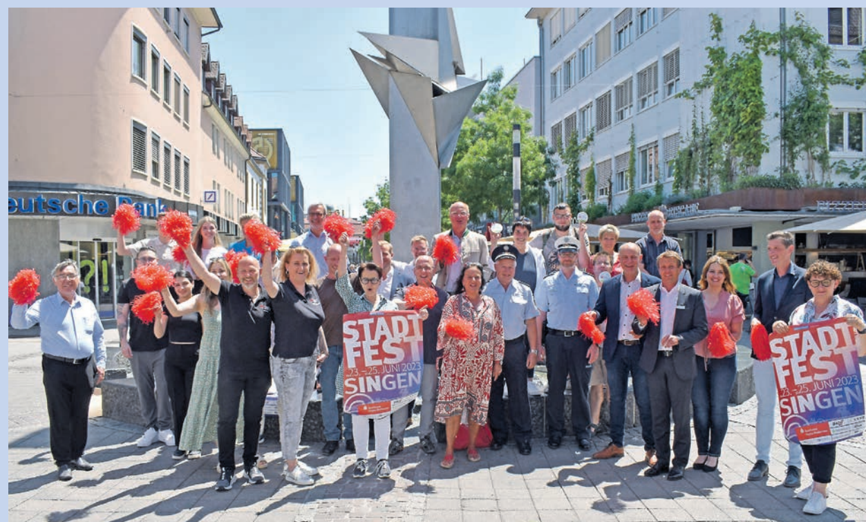
Große Freude bei Organisatoren, Sponsoren, Partnern und Freunden des Singener Stadtfestes, das von Freitag, 23. Juni (16 Uhr), bis Sonntag, 25. Juni (18 Uhr), stattfindet: 150 Stunden buntes Programm mit mitreißender Musik, Tänzerinnen und Tänzern, Attraktionen, 110 Ständen, Schlemmereien.

Was das Stadtfest alles bietet – von Speisen und Getränken bis hin zu den einzelnen Bühnenprogrammen – ist zu finden unter www.singen-totallokal.de/aktuelles/veranstaltungen/stadtfest-singen