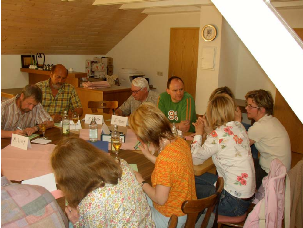
- Teilnehmerrunde von Verkehr & Mobilität, 03.05.2006 -