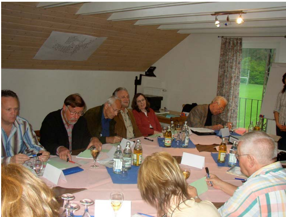
- Die Teilnehmerrunde, 26.04.2006 -

Vorstellung der einzelnen Bürger und ihrer Anlässe an der Bürgerbeteiligung teilzunehmen: in der Regel langjährige Überlinger, die ein Interesse an dem weiter funktionierenden Zusammenleben der verschiedenen Generationen in Überlingen haben, Mütter, Interesse am Vereinsleben, an der Verhinderung des Mobilfunkmastes, an dem Erhalt der Grünzüge.