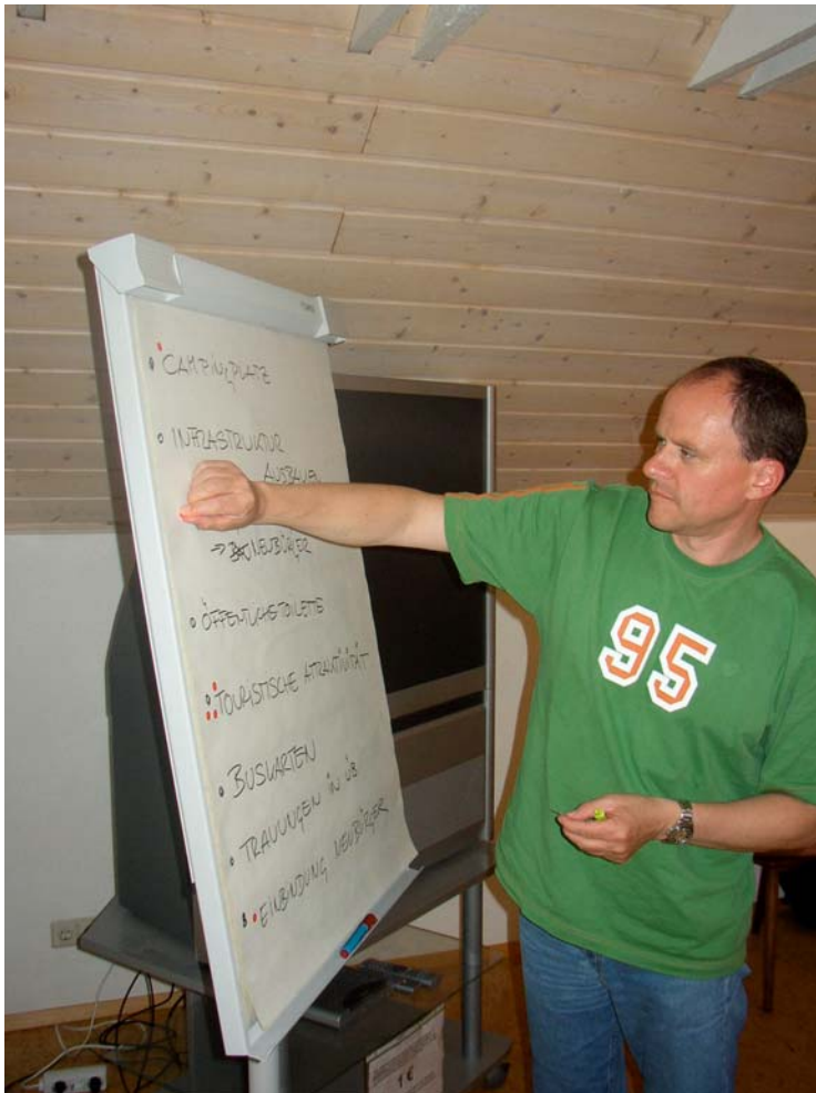
- Bewertung der Themenschwerpunkte Infrastruktur, Tourismus & Wirtschaft, 16.05.2006 -