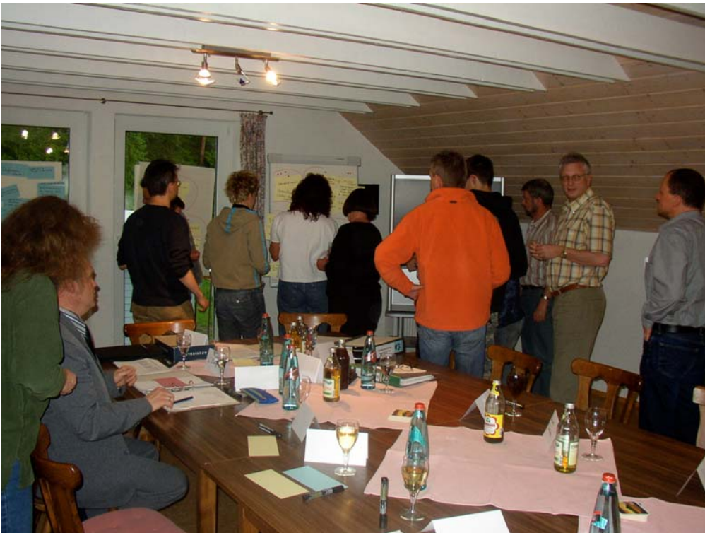
- Bewertung der Themenschwerpunkte, 09.05.2006 -

Thema „Mobilfunk“ wird sehr persönlich ausgetragen starker Streit wegen UMTS Dorfspaltung wegen Streit um Handy-Mast