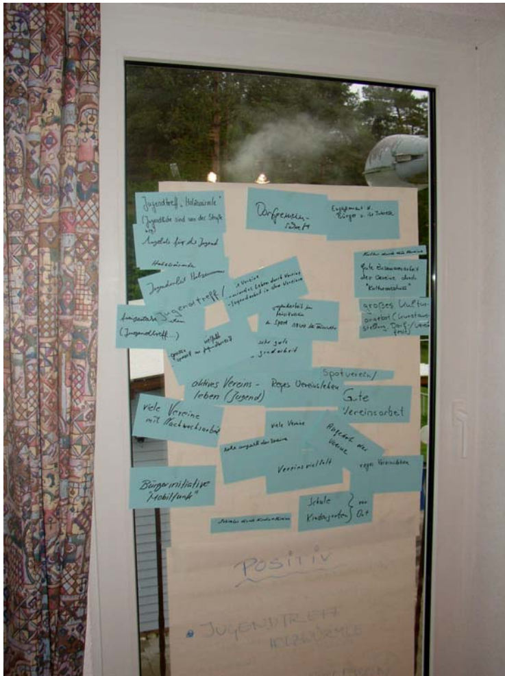
- positive Aspekte von Jugend, Soziales & Kultur, 09.05.2006 -