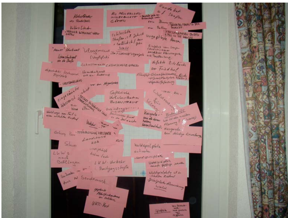
- Negative Aspekte von Ortsbild – Städtebau – Landschaft, 26.04.2006 -

kein Mitteilungsblatt kein Pressemitarbeiter