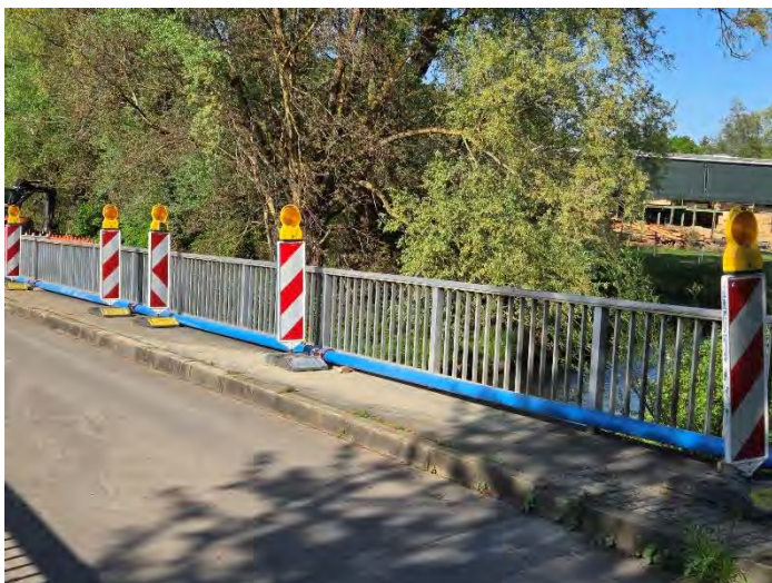
Provisorische Trinkwasserleitung zur Versorgung des Unterdorfes

Die Stelle des Wasseraustritts befindet sich direkt unter der Aach, dadurch erschwert es die Reparatur. Um den Schaden zu beheben, werden wir die Leitung im Bereich der Aach im Spülbohrverfahren erneuern. Dabei handelt es sich um eine grabenlose Technik zur Wasserleitungsverlegung, die Unterquerungen von Straßen oder Gebäuden ohne große Baugruben ermöglicht. Da für die Reparatur spezielles Material erforderlich ist, wird vorerst eine Notversorgung über die Aachbrücke eingerichtet werden. Der genaue Zeitrahmen für die Reparatur lässt sich momentan noch nicht abschätzen. Zu keinem Zeitpunkt hat eine Gefahr einer Verunreinigung des Wassers bestanden.