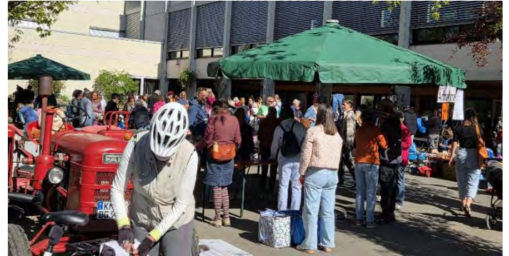
Großer Ansturm auf die zu verschenkenden Waren

Auf- und Abbau sowie der Besucheransturm wurden vom eingespielten Helferteam wieder mühelos bewältigt.