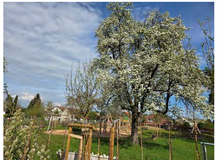
Spielplatz „Auf der Kellerbreiten“ mit voller Obstbaumblüte

Die Eröffnung des Spielplatzes „Auf der Kellerbreiten“ zieht sich aktuell laut Auskunft der Abteilung Grün- und Gewässer noch etwas hin. Da der Rasen noch nicht angewachsen ist und an einigen Stellen noch einmal nachgesäht werden muss, wird eine Eröffnung voraussichtlich erst Ende Mai erfolgen können. Den Spielplatz vorzeitig zu öffnen macht keinen Sinn, da sonst die Schäden an der Grasnarbe so hoch wären, dass dieser dann zu einem späteren Zeitpunkt noch einmal gesperrt werden müsste. Wir werden zur Eröffnung rechtzeitig informieren und dies mit einem kleinen Einweihungsfest verbinden.