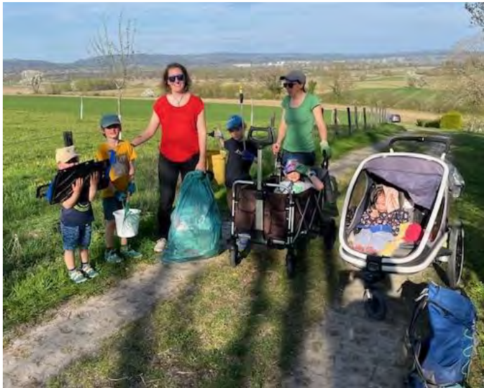
Viele fleissige Hände beim Müll sammeln

Wir waren unterwegs mit 3 Erwachsenen und 5 Kindern und haben insgesamt 12 kg Müll und zusätzlich 15 Glasflaschen gesammelt. Den Großteil davon haben wir im Bereich des Schulsportplatzes gefunden. Im restlichen Oberdorf konnten wir fast ausschließlich Zigarettenkippen finden. Hier gab es recht wenig zu tun für uns! Demnächst wollen wir uns noch den Bereich rund um die Plattform vorknöpfen.