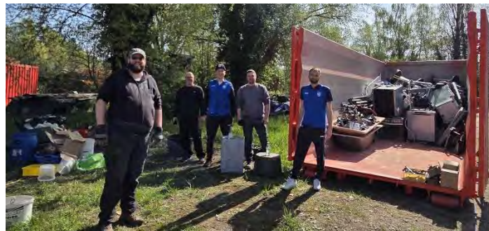
Helfer der Schrottsammlung vom Förderverein SV Bohlingen

Der Förderverein SV Bohlingen e.V. bedankt sich bei allen Bürgern für den abgegebenen Schrott, der wieder ein voller Absatzcontainer ergab. Der Erlös kommt der Bohlinger Fußballjugend zugute.