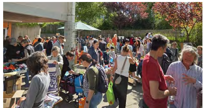
Viele Besucher nutzten den Verschenk's doch Markt auch als Plattform für ein kommunikatives Gespräch

Wie immer kümmerte sich die Jugendfeuerwehr am Grill und an der Kuchentheke bestens um das leibliche Wohl der Besucher.