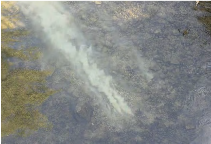
Austretendes Trinkwasser in die Aach

Am Samstag, 18. April 2026 kam es zu einem Wasserrohrbruch an der Hauptleitung für das Unterdorf.