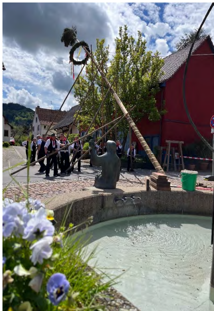
Maibaumstellen durch die Holzer am Narrenbrunnen