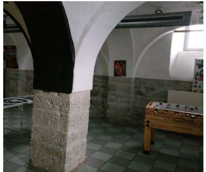
Jugendkeller im Rathauskeller

Nach sieben intensiven und ereignisreichen Jahren haben wir im vergangenen Monat zum letzten Mal die Türen des Jugendkellers unter unserer Leitung geöffnet. Es war ein bewegender Abschied von einem Raum, der für uns und viele Jugendliche im Ort über lange Zeit ein fester Bezugspunkt war.