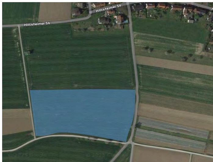
Lageplan des Feuerwehrlager

Das Kreisjugendfeuerwehr-Zeltlager im Sommer 2026 hier in Bohlingen. Wenn dort genauso viel Teamgeist und gute Laune herrschen wie beim Frühlingsfest, steht einem unvergesslichen Erlebnis nichts im Weg.