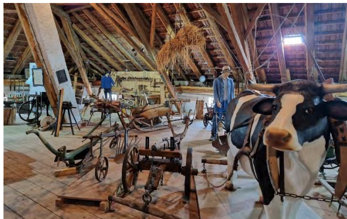
Museum im Rathausspeicher