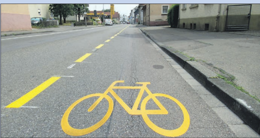
Piktogramm-kette oder ein Schutzstreifen – was ist sicherer für Radler? Das will die Stadt Singen in einer Testphase herausfinden. Wer mag, kann sich daran beteiligen!