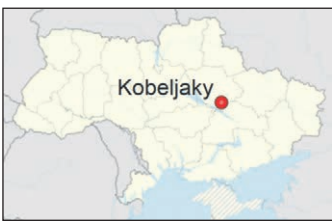
Das Bild zeigt die Lage Kobeljakis in der Ukraine.