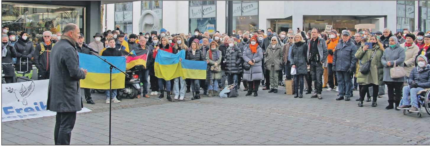
Gut 300 Menschen nahmen in der Fußgängerzone an der Solidaritätskundgebung „Für Frieden und Freiheit in Europa“ und Singens ukrainischer Partnerstadt Kobeljaki teil.

Weitere Informationen unter www.singen.de