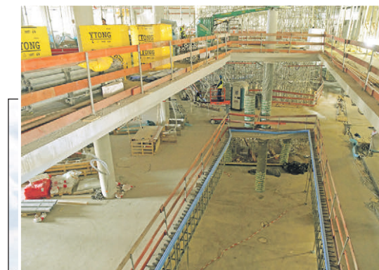
Die Cano-Baustelle aus einem anderen Blickwinkel (fotografiert im Juni). Das neue Shopping-Center in Singen eröffnet am 19. November.