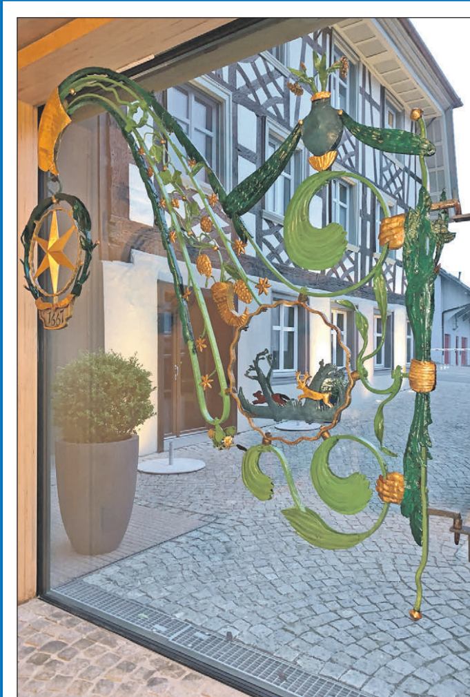
Der Stern des Gasthauses „Sternen“: Die Denkmalstiftung fördert die Restaurierung des historisch bedeutsamen Wirtshausschildes.