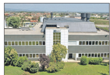
An einem Impfstoff gegen das Coronavirus forscht das Istituto di Ricerca Biologico Molecolare di Pomezia (IRBM).

Der LSK möchte mit seinem Projekt „Zukunft Barrierefreiheit 4.0“ und einem landesweiten Kompetenznetzwerk dazu beitragen, dass der barrierefreie Zugang auf allen Ebenen in den Städten und Gemeinden auch weiterhin vorangetrieben wird.