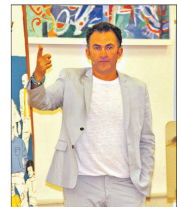
Kabarettist Fatih Çevikkollu war der zweite Programmpunkt bei der SKP-Veranstaltung.

Der Kabarettist Fatih Çevikkollu vollführte anschließend sein hintergründiges und zielsicheres Programm – mal nachdenklich, mal bissig, aber immer so, dass seine Sicht der Dinge die Zuschauer nicht nur zum Lachen brachte. Seine Botschaft war eine Einladung zum Perspektivwechsel. Der Abend wurde durch das Bundesprogramm „Demokratie leben!“ des Bundesministeriums für Familie, Senioren, Frauen und Jugend gefördert.