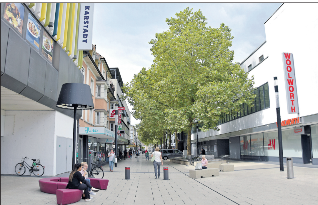
Die Sondernutzungsgebühren für die Außengastronomie sowie für den Außenbereich von Einzelhandelsgeschäften werden für dieses Jahr erlassen, dies hat der Singener Gemeinderat beschlossen.

Das vermag zu Unverständnis führen, ist aber leider nicht anders handhabbar.