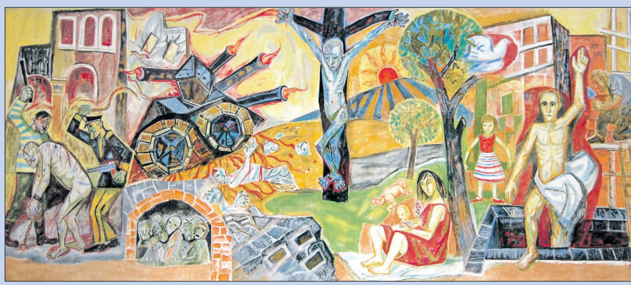
Das monumentale Wandbild „Krieg und Frieden“ von Otto Dix im Ratssaal des Singener Rathauses kann in der Ferienzeit an den Wochenenden von Besuchern besichtigt werden.

derne exemplarisches, geschichtlich und künstlerisch spannendes Werk wartet auf die Besucherinnen und Besucher.