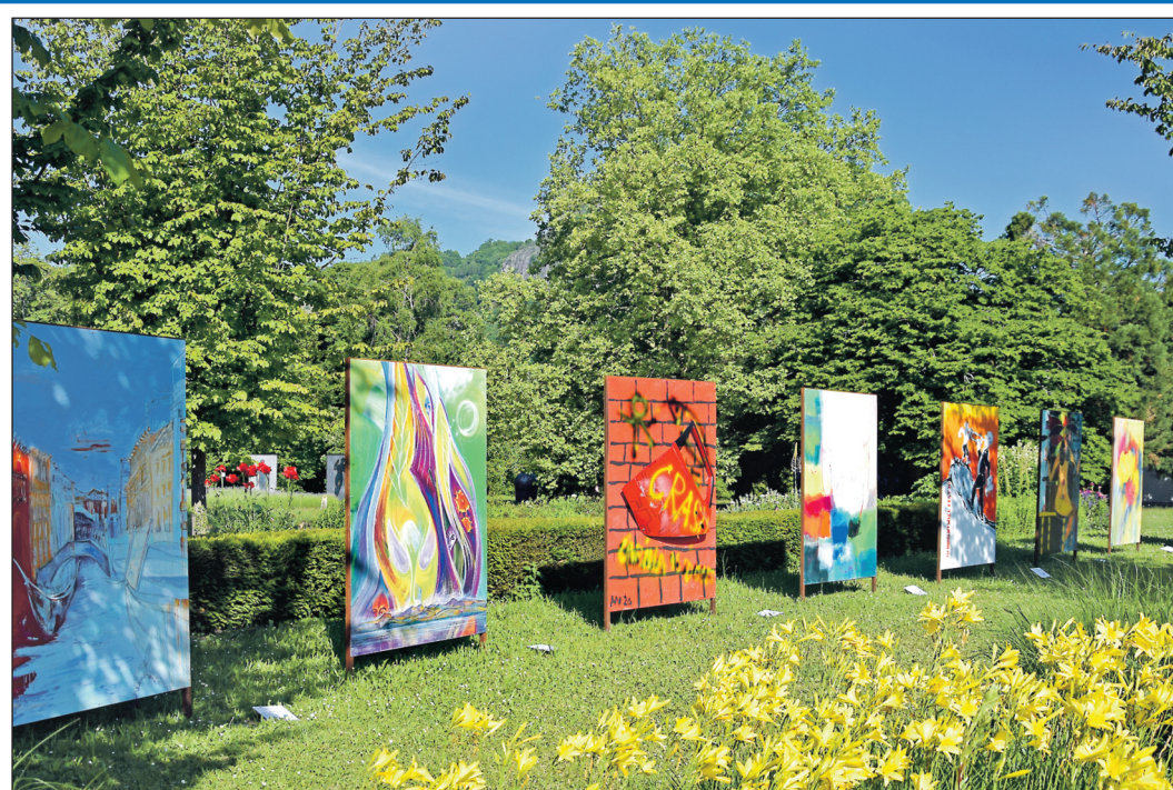
Bis zum 12. September kann man die 21 Werke der Singener Maler und Gäste im Stadtgarten bewundern.