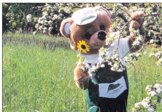
Gestatten: das Singener Landesgartenschau-Werbemaskottchen „Twilli“.